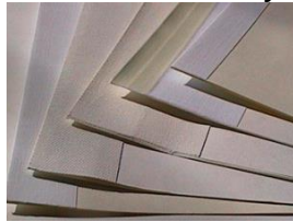
Large variety of different products Grosse Produktevielfalt