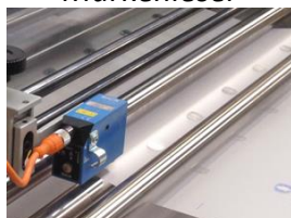
Mark reader Markenleser