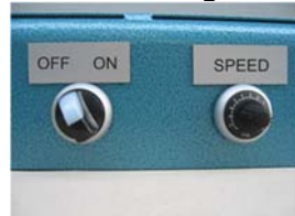
Infinitely variable speed Stufenlos verstellbare Geschwindigkeit