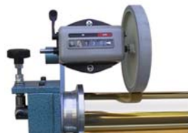
Linear measurement unit Längenmeseinheit