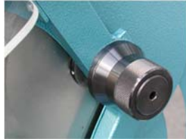
Knife turn knob Messerdrehknopf