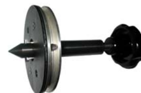
Shaft for 3/4" sleeves Welle für Ø19 mm (3/4") Hülsen