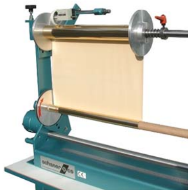
RG machine with option winding unit and linear measure unit RG Maschine mit Option Umwickelvorrichtung und Längenmesseinheit

This is a manual cutting machine for daily use and available in three different sizes. The core is fitted with a knife protection. The machine is suited with a measuring unit to preset the cut-off width of the foil. For extra strong winded rolls we recommend the option "winding unit".