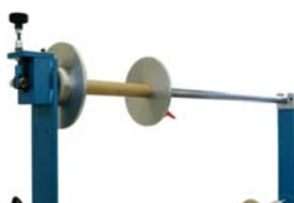
Winding unit Umwickelvorrichtung