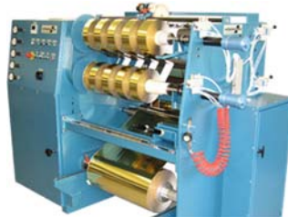
Slit and spool on 3 inches cores Schneiden und auf 75mm Hülsen wickeln