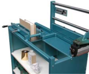
Feeding machine with book Buch einlegen