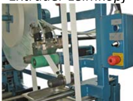
Extruder glue head Extruder Leimkopf