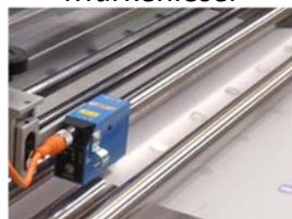
Mark reader Markenleser