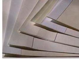
Large variety of different products Grosse Produktevielfalt