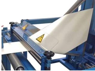
Former fold with pinch rollers Trichterfalz mit Pressrollen