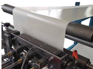
hot melt glue system Heissleim Auftragsystem