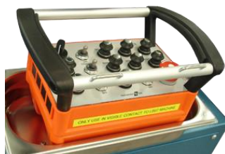
Wireless remote control Kabellose Fernbedienung