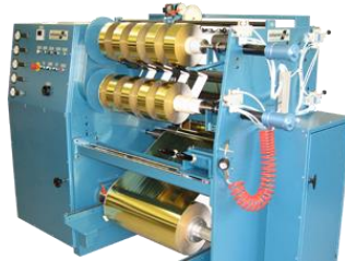
Slit and spool on 3 inches cores Schneiden und auf 75mm Hülsen wickeln